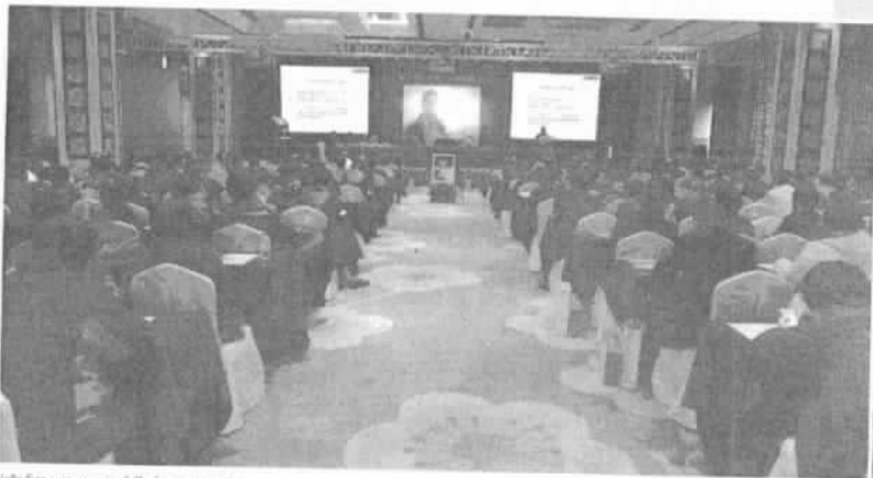
Nella foto uno scorcio dell'aula congressuale